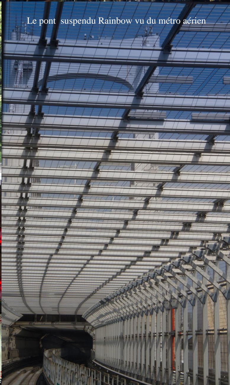
Le pont suspendu Rainbow vu du métro aérien