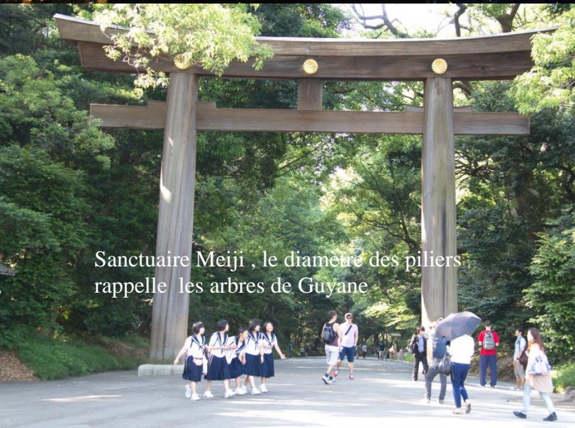
Sanctuaire Meiji , le diamètre des piliers rappelle les arbres de Guyane