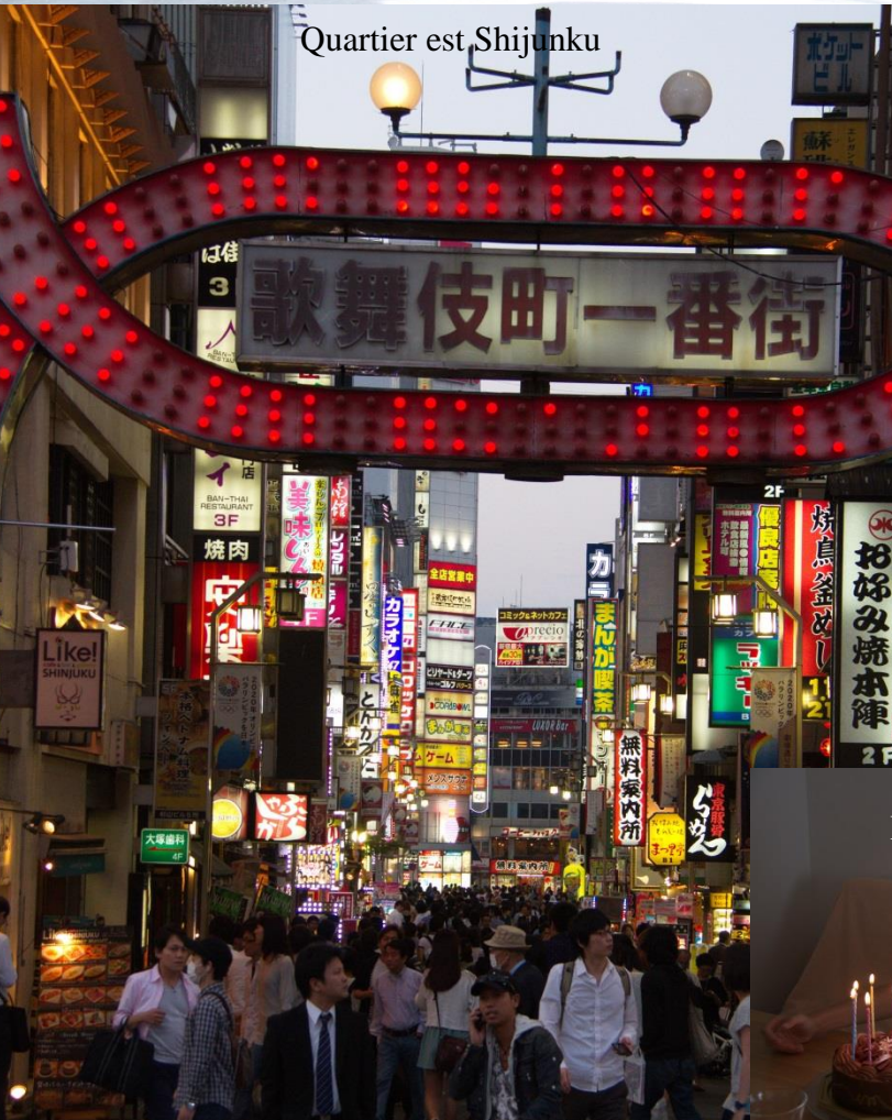
Quartier est Shijunku