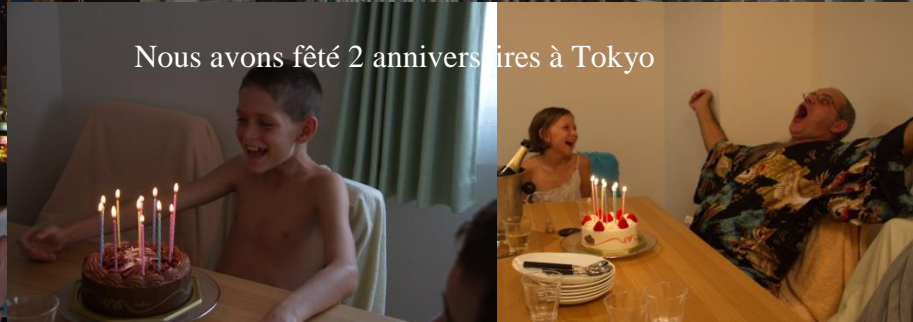
Nous avons fêté 2 anniversaires à Tokyo