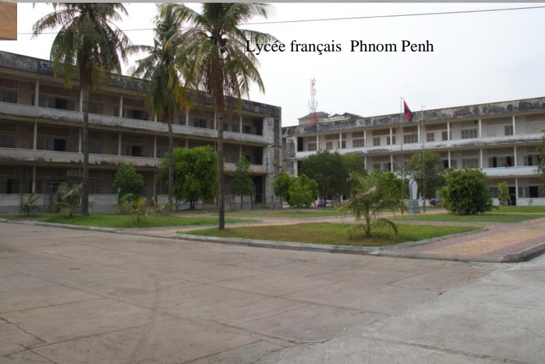
Lycée français Phnom Penh