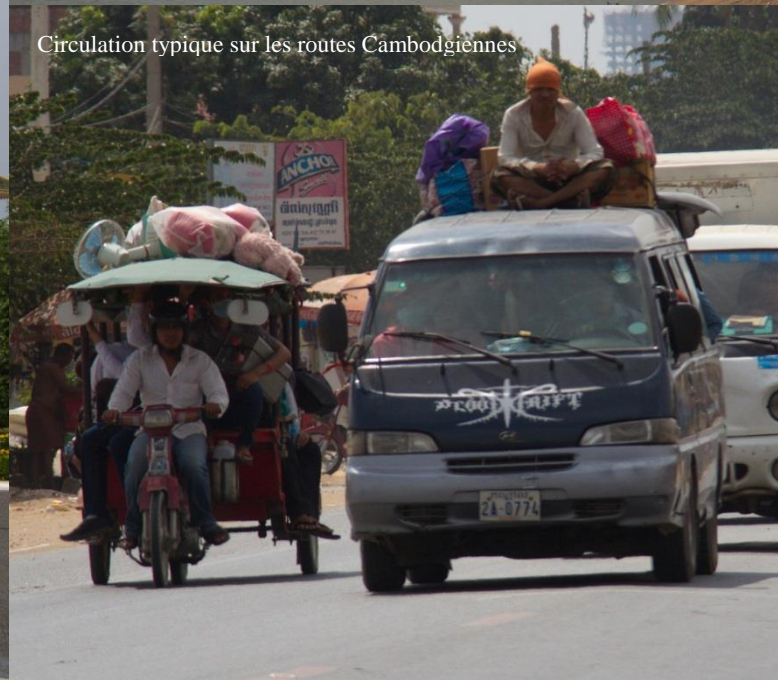
Circulation typique sur les routes Cambodgiennes