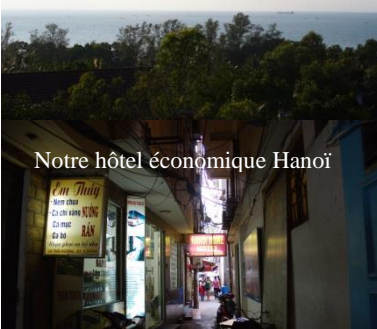
Notre hôtel économique Hanoï