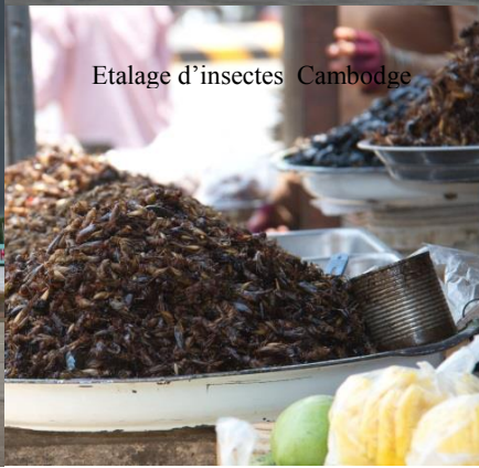
Photo sur nos amis à 4 pattes sur étal que je peux vous envoyer sur demande express.

Ame sensible, aimant les chiens, abstention recommandée