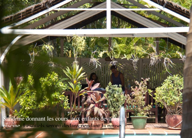
Sandrine donnant les cours aux enfants devant la piscine. Lesquels seront dedans pendant la pause.