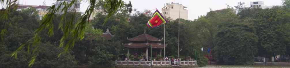
Temple de la montagne de Jade