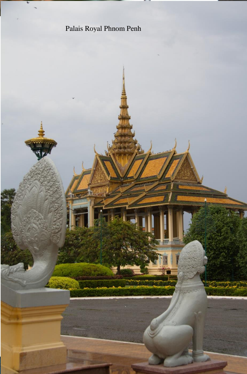
Palais Royal Phnom Penh