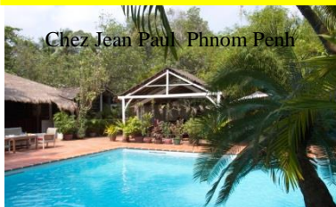
Chez Jean Paul Phnom Penh

En ce début mai, nous sommes au Vietnam à Hanoï, dans un petit hôtel situé dans l'hyper centre près de la cathédrale. Auparavant au mois d'avril, nous étions à Sihanoukville, une soi-disant station balnéaire dans le sud du Cambodge. Puis début avril nous sommes restés à Phnom Penh, la capitale du Cambodge, le temps de faire nos visas